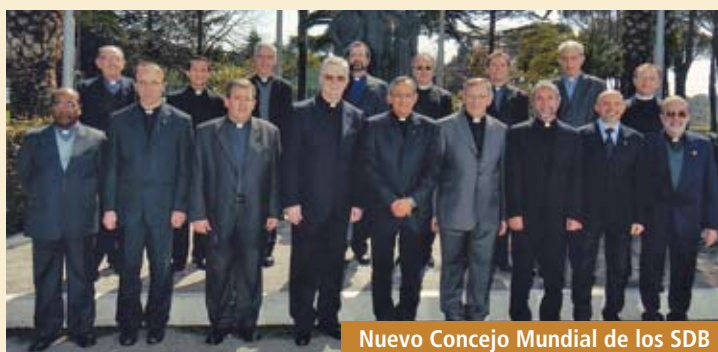
Nuevo Concejo Mundial de los SDB

En esa asamblea, la número 26 en la historia salesiana, también son elegidos los salesianos que deben asumir el servicio de animación de toda la congregación.