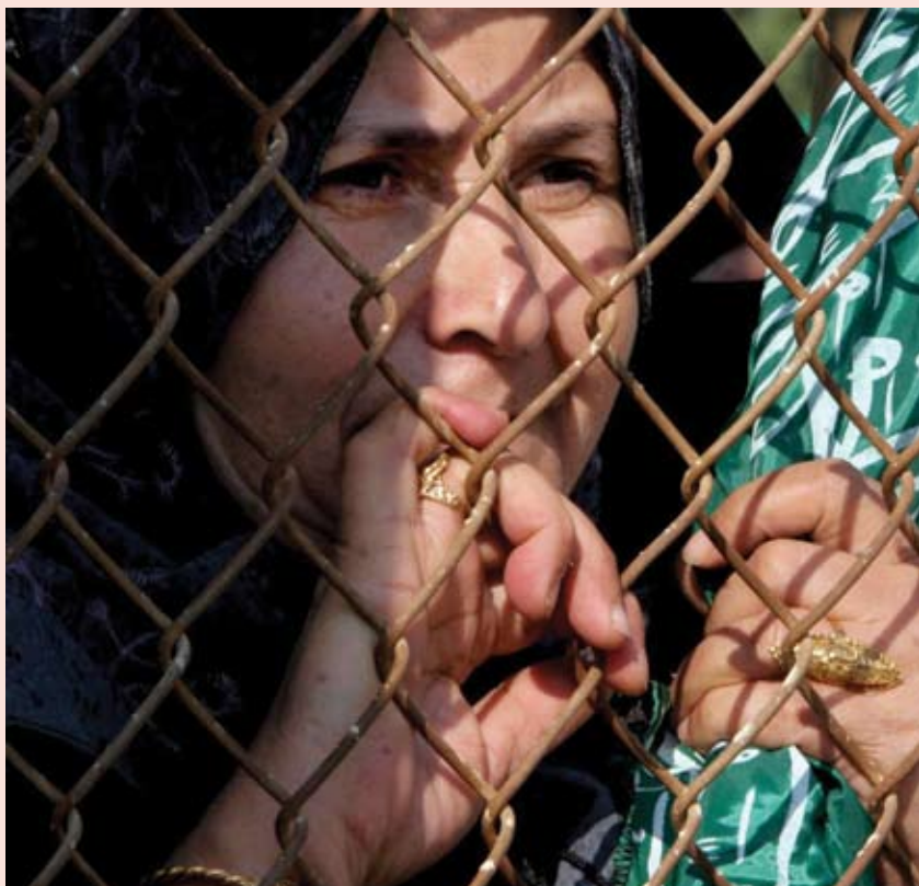
Estas mujeres son las únicas que no se escandalizaron de Jesús.

Se discute vivamente desde hace algún tiempo quién fue el que quiso la muerte de Jesús: los jefes judíos o Pilato, o los unos y el otro. Una cosa es cierta en cualquier caso: fueron los hombres, no las mujeres. Ninguna mujer está involucrada,