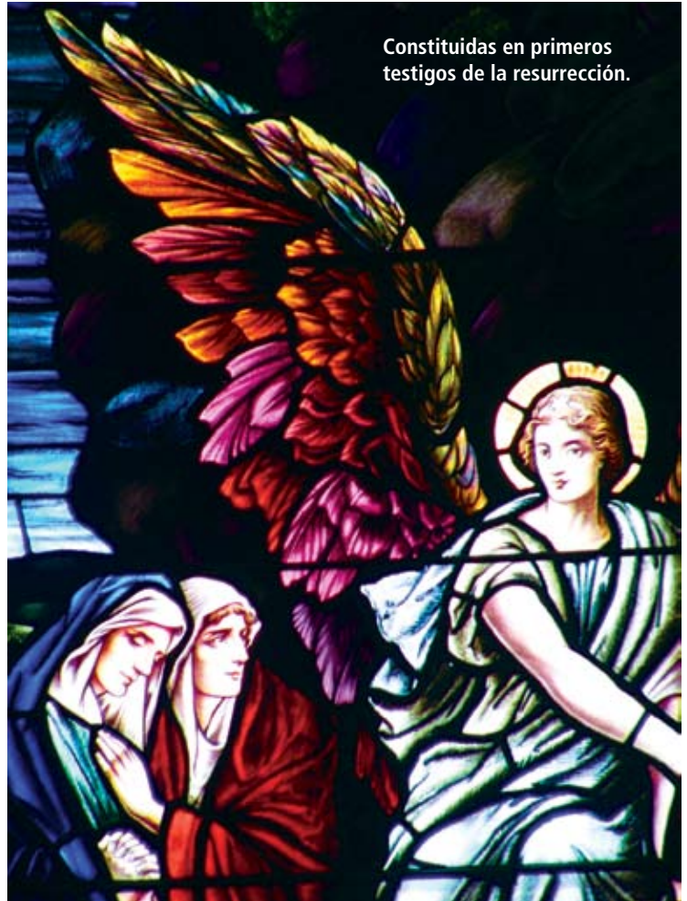
Constituidas en primeros testigos de la resurrección.