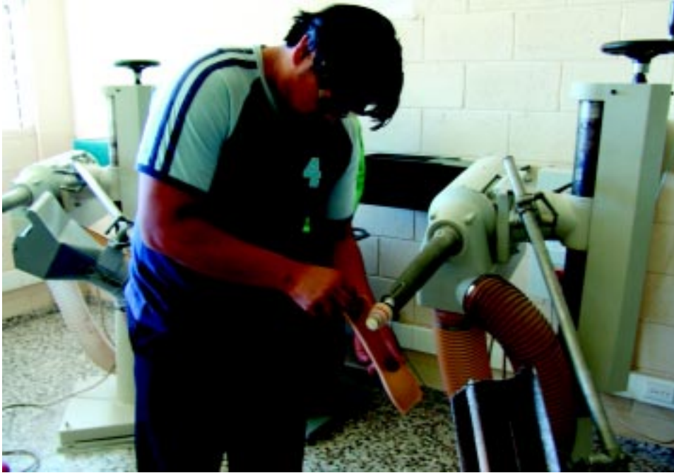
Disparidad entre el sistema educativo y el sistema productivo.