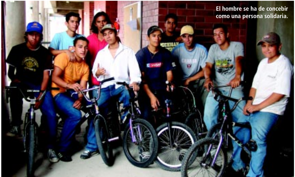
El hombre se ha de concebir como una persona solidaria.