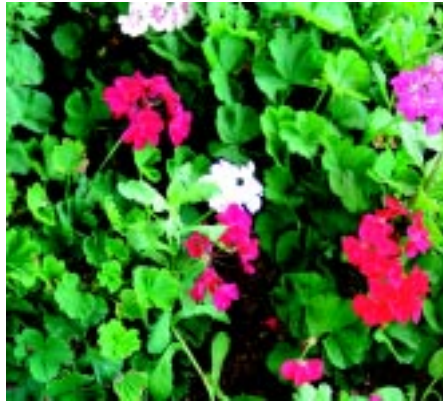
La hierba del campo florece en la mañana y en la tarde ya la han cortado.

Calderón de la Barca tiene otra bella obra de teatro titulada: “La vida es sueño”. El autor en esta obra sostiene que mientras vivimos, soñamos; cuando morimos, despertamos. Durante el sueño fantaseamos en tantas cosas. Lo cierto que, al despertar, nos damos cuenta de que todo fue una ilusión. Por eso Jesús advertía: “Velen, pues, no saben el día ni la hora en que vendrá el Hijo del Hombre” (Mt 25, 13). Nunca Jesús quiso infundir miedo a la muerte. Su intención, al hablarnos