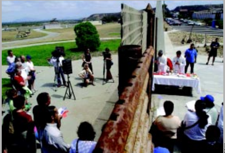
La Iglesia católica contribuye con su labor evangelizadora humanitaria.

Un dato importante es que, además de los obispos de México y los Estados Unidos, fueron invitados a participar obispos de las Conferencias Episcopales de Centroamérica, dado que el fenómeno migratorio en América Latina es un tema que comparten y sobre el cual pueden hacer aportaciones valiosas.