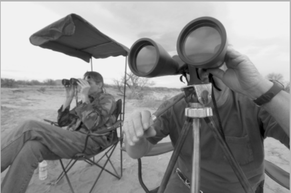
Ojos inmisericordes que detectan fríamente a los que logran dar el salto arriesgado.