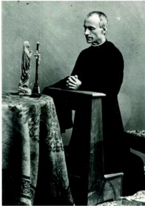
Trata de hacerte querer antes que hacerte temer.