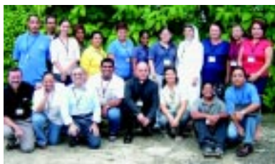
Delegación CAM - Sur

Panamá tiene activos dos centros de cooperadores: en la Basílica Don Bos- co y en el Instituto Técnico Don Bos- co. Cada centro reúne unos 20 co- operadores.