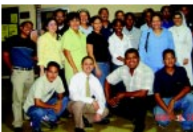
Cooperadores de Panamá

Es notable resaltar que, durante una audiencia, el Papa le había sugerido que incluyera en ella a las mujeres, sin crear una tercera orden especial para ellas, ligada a las Hijas de María Auxiliadora, como en un primer momento había tenido intención de hacer.