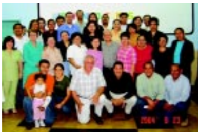
Cooperadores de El Salvador

Al ir aumentando el éxito, se tiene la impresión de que las ideas de Don Bosco acerca de los cooperadores se ensanchan. La asociación se convierte cada vez más, a sus ojos, en un organismo eclesial, que exige de sus miembros un compromiso personal.