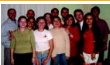
Técnico San José - Costa Rica