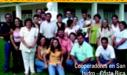
Cooperadores en San Isidro - Costa Rica