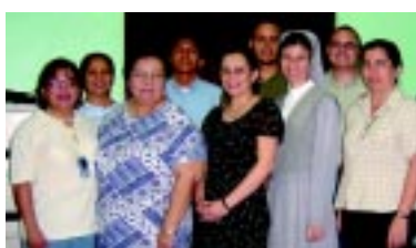
Cooperadores en San Pedro Sula - Honduras

Efectivamente, las constituciones presentadas en Roma en 1864 contenían un capítulo, el dieciséis, consagrado a los "miembros externos". ¿Qué pensaba Roma de todo esto? Impugnó los artículos relacionados.