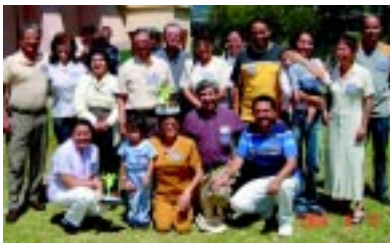
Cooperadores en el Teologado de Ciudad Guatemala

Por consejo de algún salesiano, Don Bosco simplificó el título a Unión Cristiana. Luego, el reglamento fue retocado una vez más y titulado Asociación de Buenas Obras.