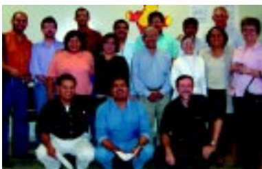
Consejo CAM - Norte