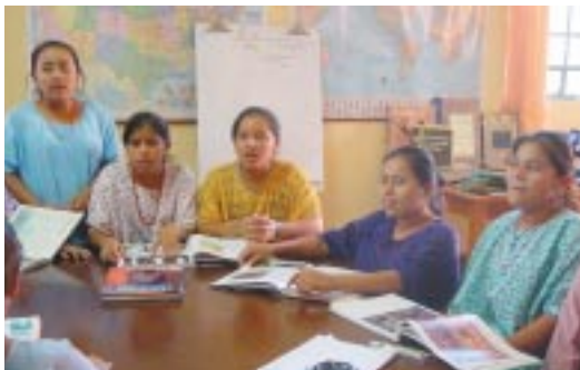
Indígenas qeqchí de la misión salesiana de Carchá.