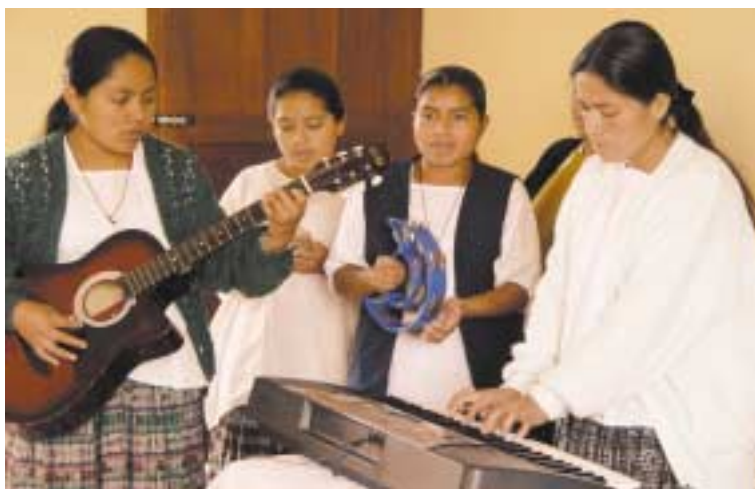
Instrumentos musicales comenzaron a incorporarse para acompañar los cantos.

Y esto sucedía en México como en Perú, en Guatemala como en Para-