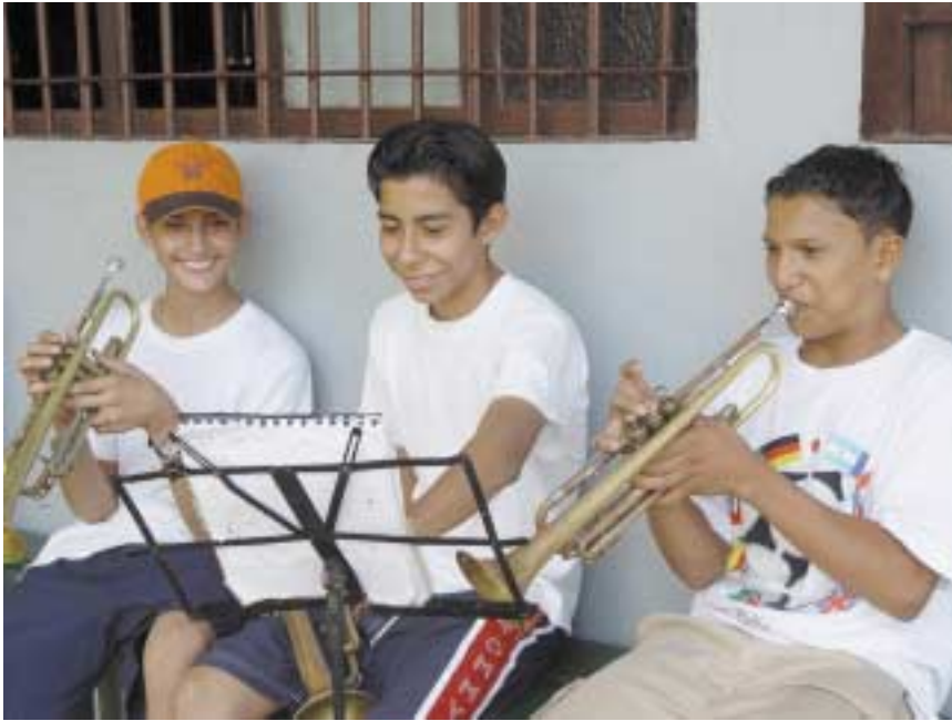
La música de los muchachos se escucha con el corazón