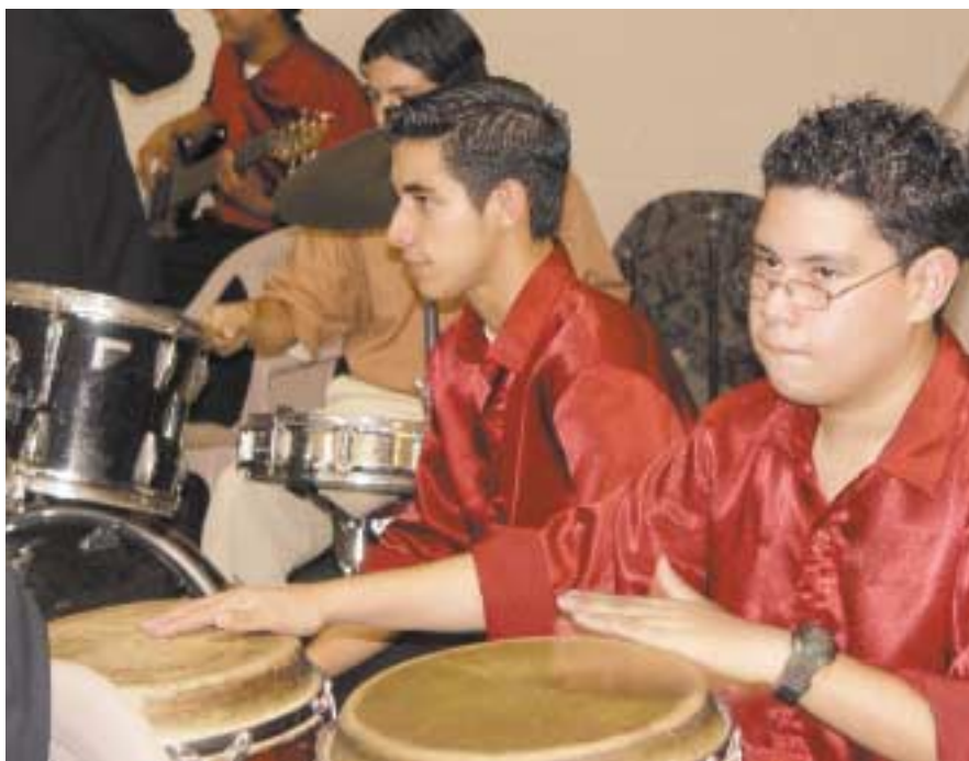
La música y el canto contribuyen a la educación religiosa y moral

Cuenta el biógrafo: "Don Bosco, como experto educador, quería a toda costa desterrar del Oratorio el monótono sucederse de jornadas grises, que tanto aburren y perjudican el alma juvenil y favorecen la indolencia y el desarrollo de malsanas tendencias". La banda actuaba en las fiestas, recibía a los ilustres personajes que visitaban el Oratorio, acompañaba las excursiones de los jóvenes por los pueblos del Monferrato; era parte importante en la vida de la casa de Don Bosco.