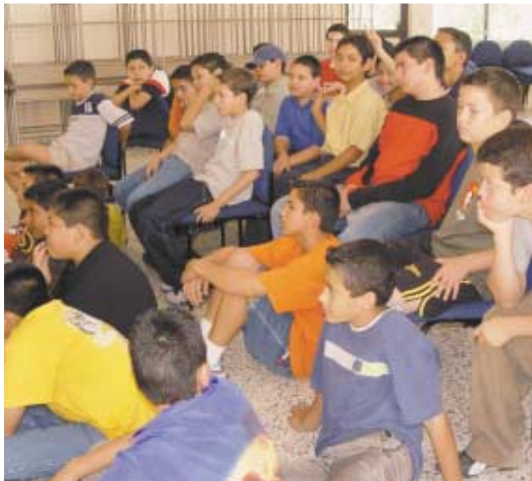
Alegría que brota de un corazón en paz.

¿Y qué más? Don Bosco cuidaba de que en su Oratorio no entraran personas peligrosas, panfletos sectarios, figuras obscenas, todo lo que pudiera poner en peligro la débil virtud de sus jóvenes. Les inspiraba amor a la Iglesia y al Papa; los ani-