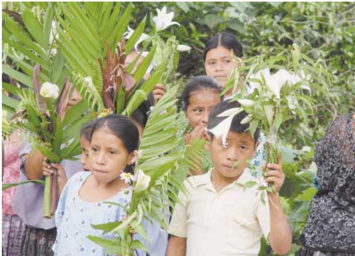
La santidad constituye el compromiso moral del cristiano