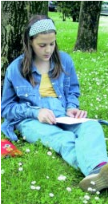
Reconciliación con el universo de la lectura y de la palabra.