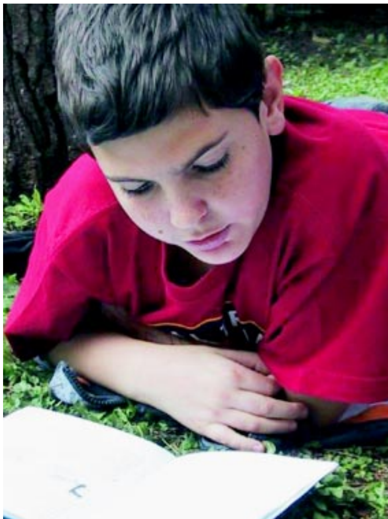
El gusto y el placer por la palabra, principalmente escrita.

Es vital que los educadores sepan estimular, en los niños, el gusto y el placer por la palabra, principalmente escrita, así como la capacidad de hacer uso de ella, correctamente. En esta tarea, los padres y madres son insustituibles.