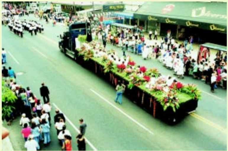
La procesión salió de la Iglesia La Merced hasta la Casa de la Virgen

Luego de la Eucaristía en la que prevaleció el orden y a la que se sumaron cientos de fieles, se realizó la procesión, que salió desde La Merced hasta la Casa de la Virgen. Al son de alegres bandas, distintos colegios y gran cantidad de perso-