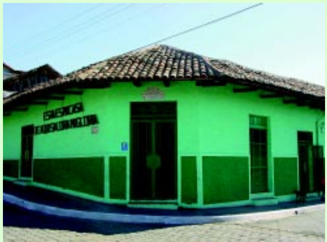
Casa natal de sor María Romero en Granada, Nicaragua.

- A Jesús todo le gusta, si se le hace con amor.