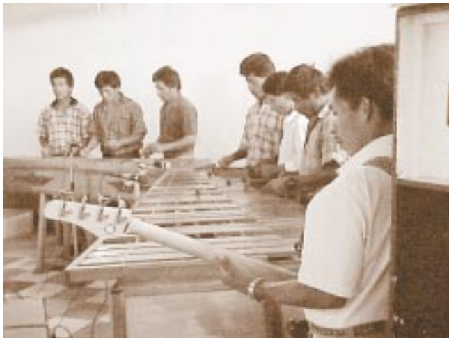
Músicos animando la celebración religiosa

La misión de Carchá se encuentra en el departamento de Alta Verapaz, Guatemala. Al principio de la conquista española del siglo XVI, esta zona era llamada Tezulutlán, país de guerra. Fray Bartolomé de las Casas se propuso conquistarla con la cruz y no con la espada. Una de las estrategias de esta conquista pacífica fue la música y el canto. Las Casas mandó traer de México más de 90 cantores y músicos indígenas ya convertidos. A los habitantes de Tezulutlán les encantó la música de esos instrumentos y los cantos. Más tarde otro misionero dominico, fray Domingo de Vico, puso la fe cristiana en versos. Estos himnos fueron aprendidos y cantados por los neófitos. A través de los siglos se conservaron muchos de esos instrumentos musicales y sus melodías; no así los cantos con su letra.