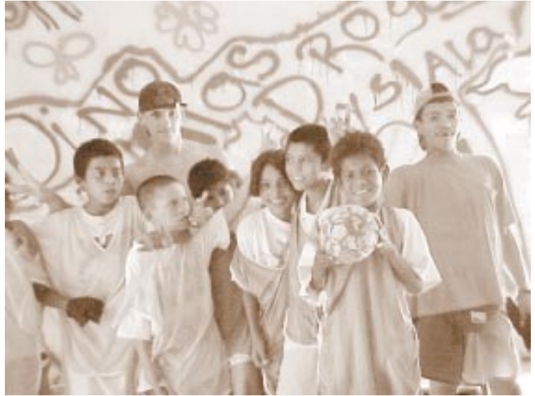
Niños de la calle en el Centro Agape

E n una calle cualquiera de uno de los tantos barrios miserables que se aglomeran a lo largo del río que divide a la ciudad de Tegucigalpa se encuentra una casa original. Una casa, como las otras, todas deprimidas por el entorno de pobreza aguda. Construcción estrecha, con sabor a viejo, medio laberíntica en su interior.