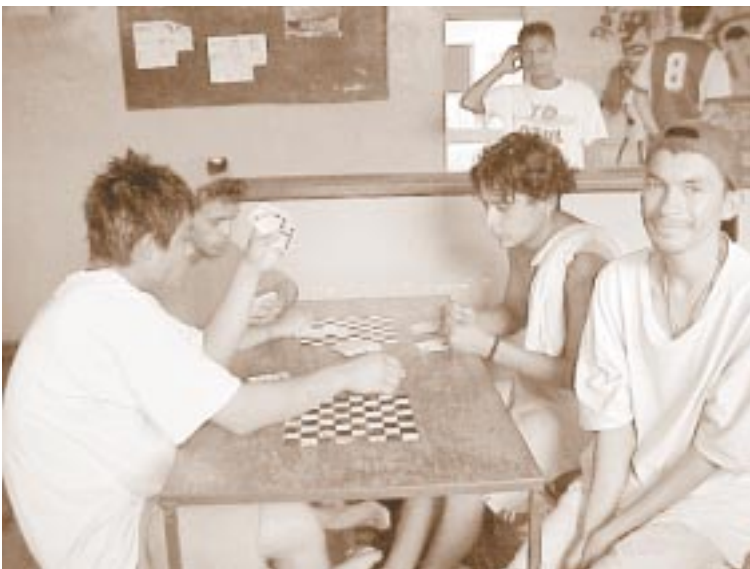
Momentos de diversión en Ágape.

Ágape me recuerda los primeros días del Oratorio en Valdocco. La diferencia es que los Don Bosco y las Mamá Margarita de aquí hablan con marcado acento español.